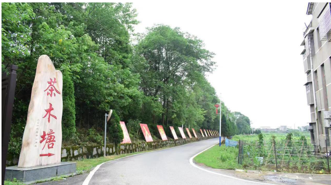
秀美屋场茶木塘路口