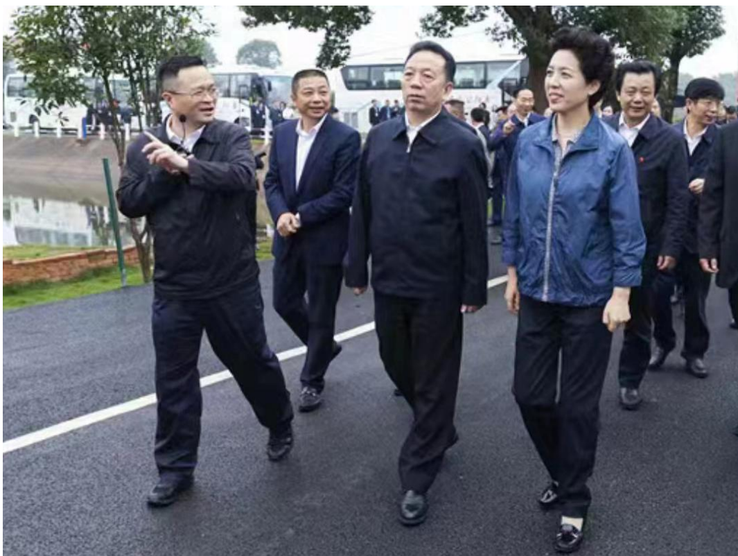
(时任)省市县领导视察茶木塘 前排 右一 省委副书记乌兰 右二 岳阳市委书记刘和生 左一汨罗 市委书记喻文 左二 汨罗市长朱平波