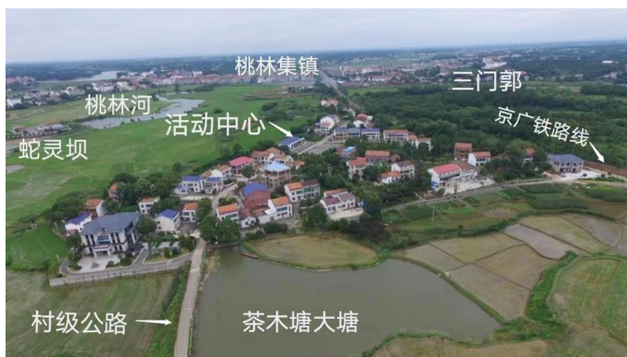
茶木塘秀美屋场竣工后航拍图